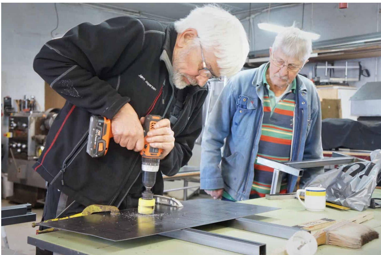
Der skal bores huller til vinduer, så insekterne let kan finde vej ind i ly og læ.

Han lover, at i hvert fald fire ud af ni hoteller nok skal nå at blive klar.