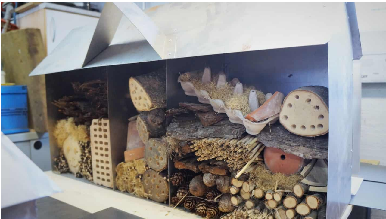
Træ, sten og grankogler skal gøre jernhotellerne attraktive for insekter.